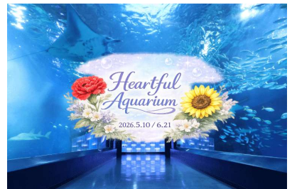
「Heartful Aquarium ※イメージ」