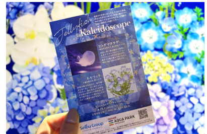
「ポストカード ※イメージ」