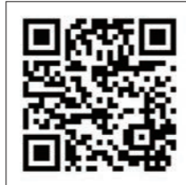
公式Webサイトはこちら