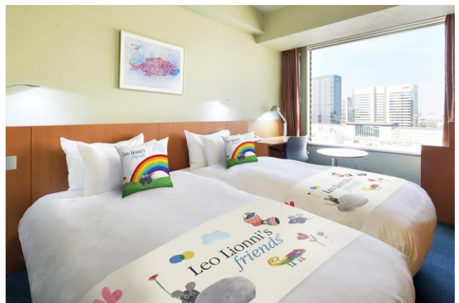
「コラボレーションルーム ※イメージ」

https://www.princehotels.co.jp/shinagawa/contents/colorfuldays/