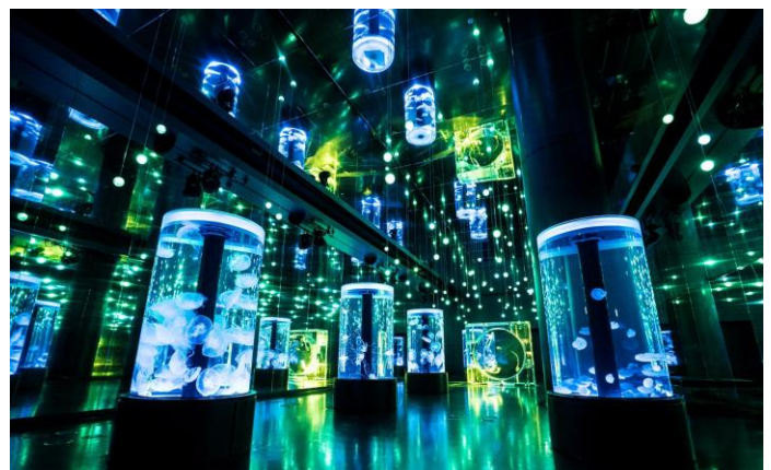
「Jellyfish Ramble ※イメージ」

音と光の演出でクラゲを魅せる展示ゾーン。幅約9m×奥行約35mにもおよぶ空間に7つの円柱水槽と全面がクリスタルのシンボリック水槽が並び、「ミズクラゲ」「アカクラゲ」など多彩な種類をご覧ください。天井から下がる98個のLEDライトと音楽の演出は3分間の通常演出と交互に5分間のフラワーアクアリウム仕様で展開。ブルーやグリーンが基調のライティングが初夏の爽やかさを演出するとともに、クラゲたちと鏡面に広がる無数の光が“絶景”を創出します。