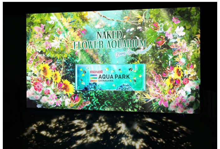
「Welcome Flower Gate ※イメージ」

ゲートを抜けると目の前に広がるのは、彩りあふれるデジタルフラワーとみずみずしい緑。お足元には木漏れ日の映像がゆらめき、初夏ならではの“絶景”がゲストをお迎えします。中央の水槽で優雅に泳ぐのは「ハタタテダイ」「ヒフキアイゴ」など個性的な姿や鮮やかなカラーをまとった魚たち。また、水槽周壁には手をかざすことで花びらが舞うインタラクティブな仕掛けもご用意しており、ゲストに心躍る体験を提供します。