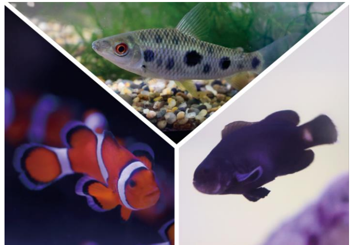
「展示生物(一部) ※イメージ」