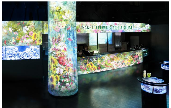
「Floral Cafe Bar ※イメージ」

発行サンゴの水槽が連なるカフェバーにも多彩なデジタルフラワーが咲き誇り、まるで花園のような空間を演出します。こちらではフラワーアクアリウム限定メニューをご用意。レッド・ブルー・グリーンと鮮やかな見た目のドリンクとスイーツは4種類で、館内での持ち歩きも可能。お好みの“フラワースポット”でお召しあがりいただくこともオススメです。