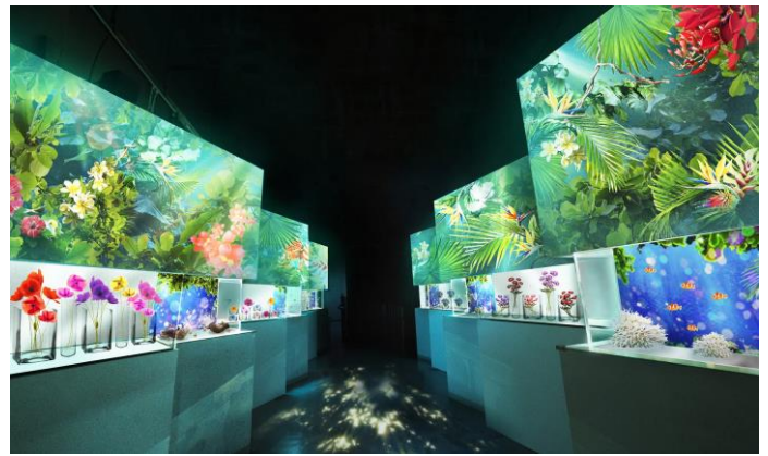
「Blooming Street ※イメージ」

花のアートワークと7つの個水槽が交互に並ぶ、アトリウムのようなエリアです。今季のテーマは“海に咲く花”。波に揺れる花のようなイソギンチャクと、その近くに棲む可憐な魚たちを集めました。ピンクやパープルの触手が美しい「ヒメハナギンチャク」とともに展示されるのは「イソギンチャクモエビ」。同種は外敵から身を守るためにイソギンチャクのそばでくらしています。デジタルフラワーにつつまれた花の回廊では、そんな海に咲く花(=イソギンチャク)と生きものの“共生”にフォーカスし、生態をご紹介します。