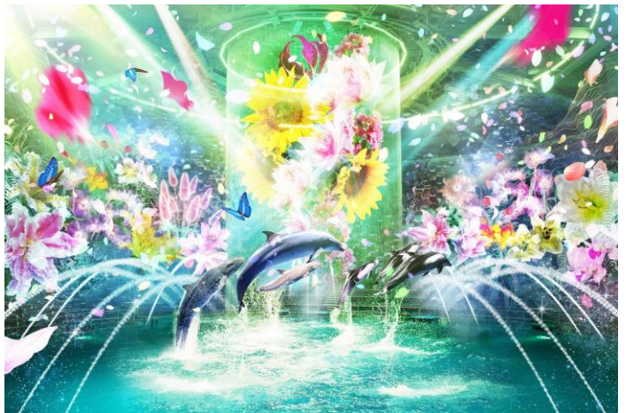
「Beauty of Flower ※イメージ」

イルカたちのダイナミックなジャンプと呼応するように可憐なデジタルフラワーが次々と咲き、プログラム中盤では水のせせらぎと優美な蓮の花が揺れるシーンで水中パフォーマンスを展開。数々の美しい場面を経て、ゲストを“初夏の海”へ誘い、深い感動をお届けします。