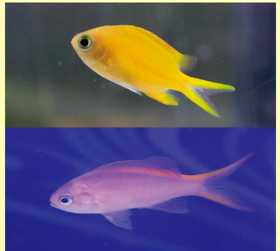
「上:ヒマワリスズメダイ / 下:パープルクイーン」