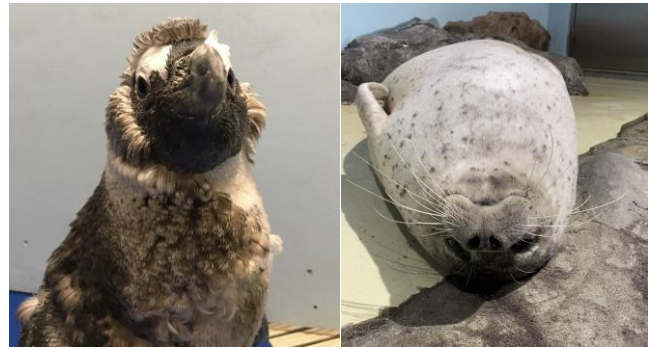
「ライフサイクルムービー ※イメージ」

コミュニケーションや健康管理を日々行っていく中で、生きものたちは季節によってもさまざまな変化を見せます。換毛期に入り、体毛がふんわりとするゴマフアザラシ、ペンギンの換羽期には種類や個体ごとに羽の抜け方が異なり、非常に個性的な姿を見せてくれます。そんな体の変化やライフサイクル、身体能力にクローズアップすることで四季の可変性を持たせたシーズンルムービーを放映します。